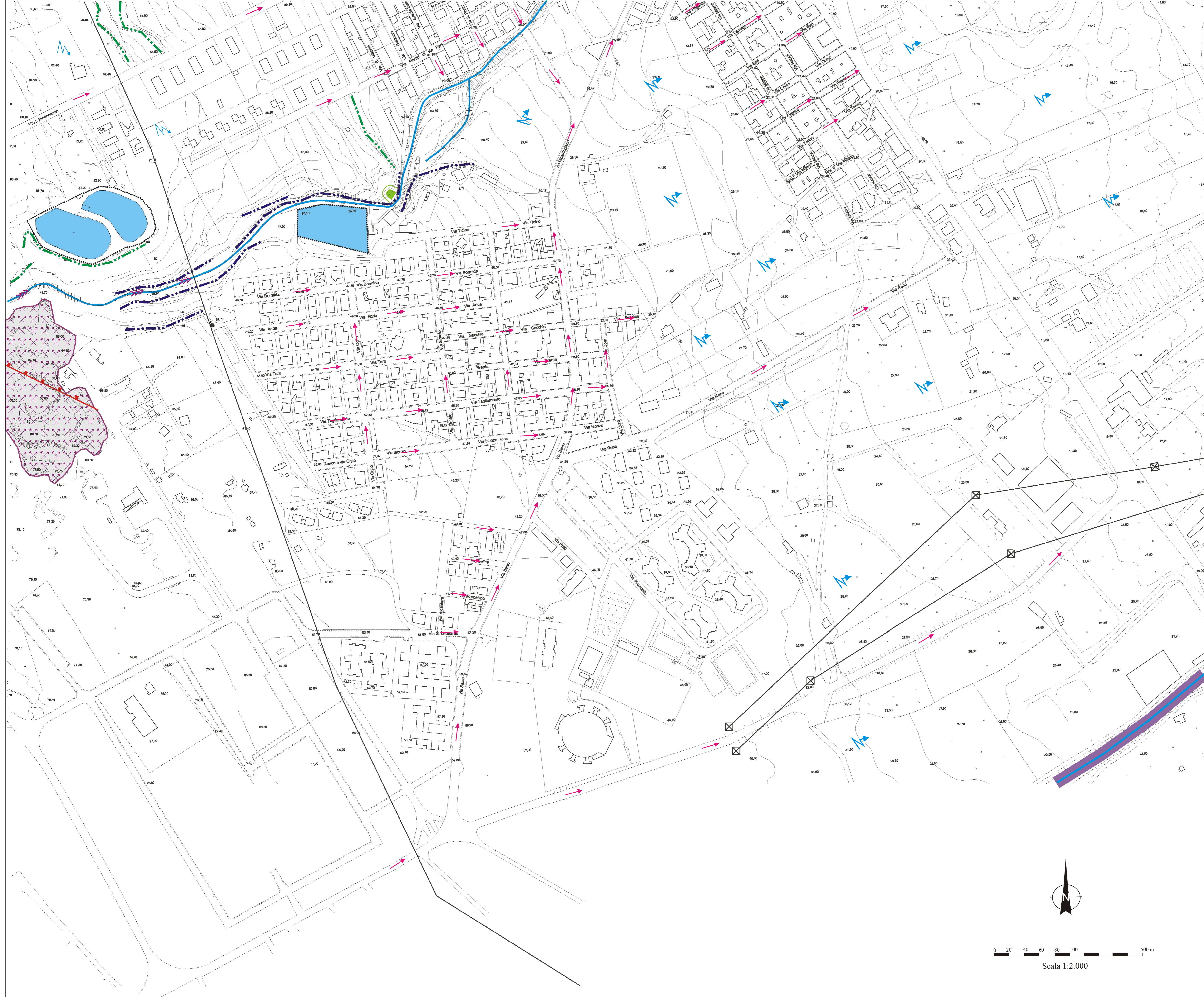
TAV. 5 C - CARTA GEOMORFOLOGICA 1:2.000